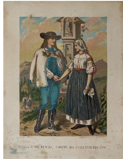
stav po reštaurovaní