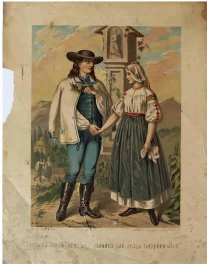
stav pred reštaurovaním